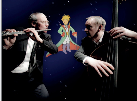
Der kleine Prinz_13.1.