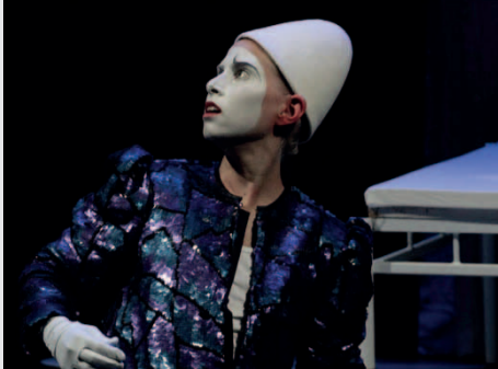
Die Blechtrommel Schauspiel

Zwei Väter hat der 1924 in Danzig geborene Oskar, dessen geistige Entwicklung nach eigenen Angaben schon bei der Geburt abgeschlossen war: den polnischen Vetter seiner Mutter, mit dem sie ein Verhältnis hat, und ihren deutschen Ehemann, den Kolonialwarenhändler Alfred Matzerath. An seinem dritten Geburtstag stoppt Oskar sein Wachstum mit einem gezielten Sturz auf der Kellertreppe und entdeckt gleichzeitig, dass er die zerstörerische Gabe besitzt, Glas zu zersingen. An diesem Tag bekommt er auch seine erste Blechtrommel geschenkt, die für ihn zum Protest- und Verweigerungsinstrument wird. Mit ihr wird er durch einen Walzertakt den martialischen Marschrhythmus der Nazis durcheinander bringen, mit ihr begleitet er den kleinvüchtigen Clown Bebra drei Jahre beim Fronttheater im besetzten Frankreich, durch sie verschuldet er den Tod seines Zweitvaters beim Einmarsch der Siegermächte 1945, mit ihr wird er auf Konzertreisen und durch den Verkauf von Schallplatten ein reicher Mann.