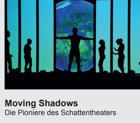
Moving Shadows Die Pioniere des Schattentheaters

Schattentheater. Shadowdance. Schattenspiel. Es gibt viele Begriffe für das Genre. Keiner reicht jedoch für die spektakuläre und herausfordernde Schattenshow "Moving Shadows" unter der Regie von Harald Fuß aus. So viele Begriffe es gibt, so viele verschiedene Varianten gibt es auch. Die Zusammensetzung all dieser Formen mit einer zusätzlichen Portion Kreativität mündet im modernen Schattentheater der Moving Shadows. Tauchen Sie ein in eine magische Schattenwelt und genießen Sie eine Show der Extraklasse! Mit erstaunlicher Präzision und verbüffelter Leichtigkeit kreieren die Mobsils charmante und einfallreiche Geschichten – von zauberhaft poesievoll bis hinreißend komisch. Das geheimnisvolle Schattenspiel der "Moving Shadows" entführt in eine fantastische Welt. Die Körper verschmelzen artistisch und werden so zu Dingen, Tieren, Pflanzen – und wieder zu Menschen. Unterstützt von mitreißender Musik entsteht ein fesselnder Bilderreigen, der Assoziationen und Emotionen weckt. Ein Spiel mit Licht und Schatten.