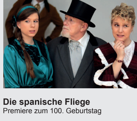
Die spanische Fliege Premiere zum 100. Geburtstag