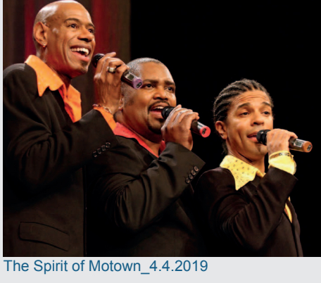
The Spirit of Motown_4.4.2019