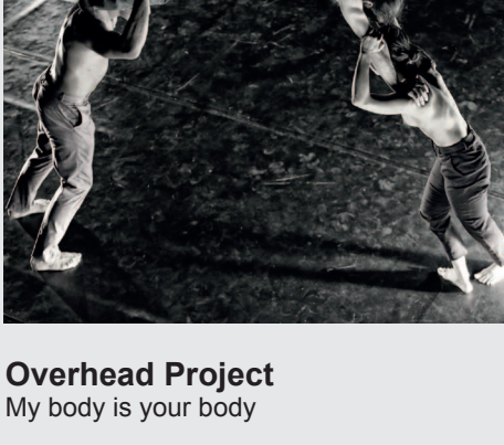
Overhead Project My body is your body

Ein außergewöhnliches Spiel von Körper und Blicken, Sichtachsen und Symmetrien! Ein ungleiches Performer-Trio konfrontiert in "My body is your body" die Zuschauer*innen mit ihrem eigenen Zuschauen, stellt unsere tradierten Blicke in Frage und verweist sie in die Ränge der bi-frontalen Blickarena: in zwei gegenüberliegenden Tribünen, ähnlich denen des Britischen Parlaments. Dazwischen: die Bühnenfläche. Zu behandelndes Objekt: der Körper inklusive dem Ich da drin. Overhead Project steht für Stücke an der Grenze von Zeitgenössischem Zirkus, Tanz und Performance. Die Kompanie wurde 2008 von dem Akrobatenduo Tim Behren und Florian Patschovsky gegründet. Zeitgleich waren sie noch Mitglieder des Freiburger Ensembles Head Feed Hands, mit deren Produktionen die Flottmann-Hallen ab 2009 den Einstieg in die Sparte Neuer Zirkus wagten. Die Arbeiten von Overhead Project wurden mehrfach international ausgezeichnet. Seit 2018 erhält die Gruppe die Spitzenförderung des Landes NRW.