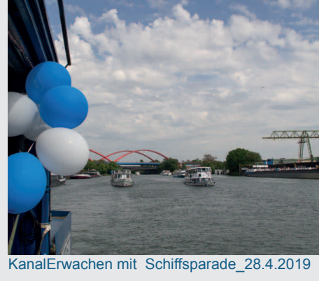
KanalErwachen mit Schiffsparade_28.4.2019